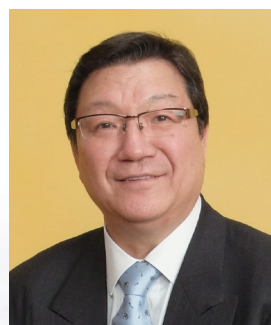
一般社団法人 家財整理相談窓口 生前整理・遺品整理・空家整理