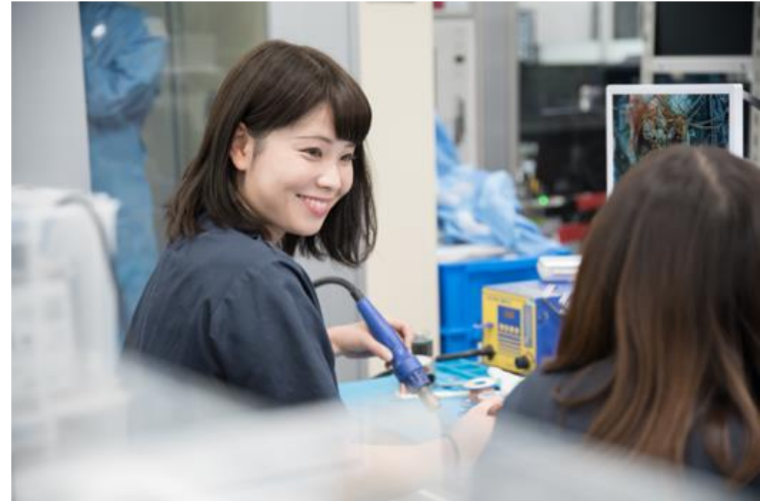
女性エンジニアも4名活躍中