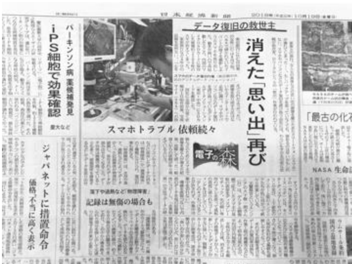
日経新聞など多くのメディアに掲載

1年2ヶ月(2017年9月1日~2018年11月5日)で387件のご相談 当社へのご依頼は10-40代が70%以上、50代以上は30%未満となっている。