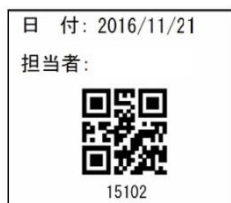
商品ラベルイメージ