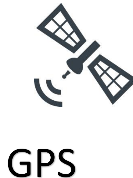
GPSシステム画面イメージ